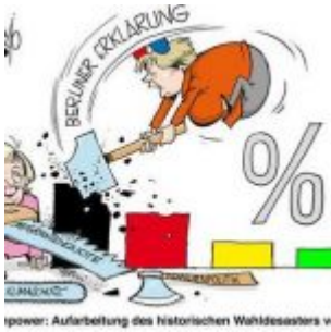
power: Aufarbeitung des historischen Wahldesasters v