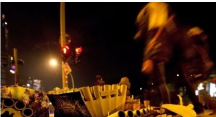
Eine Gruppe junger