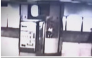
November 2016 Frontal 21 vom 8. November wurde in einem Beitrag z. B. über die der Straßen berichtet. Dabei wurden in einer Grafik fälschlicherweise Schlagern auf U-Bahnsteigen gezeigt, die nicht in diesem Zusammenhang steht sich dabei nicht um fremdenfeindliche Übergriffe, sondern um figurationsübergreifend.