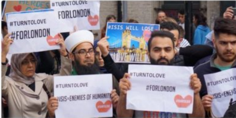
Attack brings out the best in London's Borough neighborhood

FOX NEWS zeigte die Truppe beim Blümchenhinterlegen: