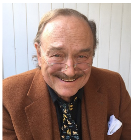
Ex-BILD-Chef Peter Bartels.

Da kommt doch Freude auf ... auf die Wahlen in Bayern!!