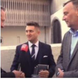
BILD VOM PI-NEWS-INTERVIEW MIT DEM "EUROPÄISCHEN PATRIOTEN DES JAHRES 2018"