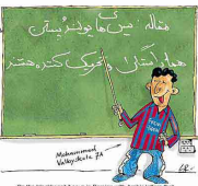
On the blackboard it says in Persian: "We have no more virgins." "Mazda's Persian journalists are a bunch of reactionary provocateurs!"