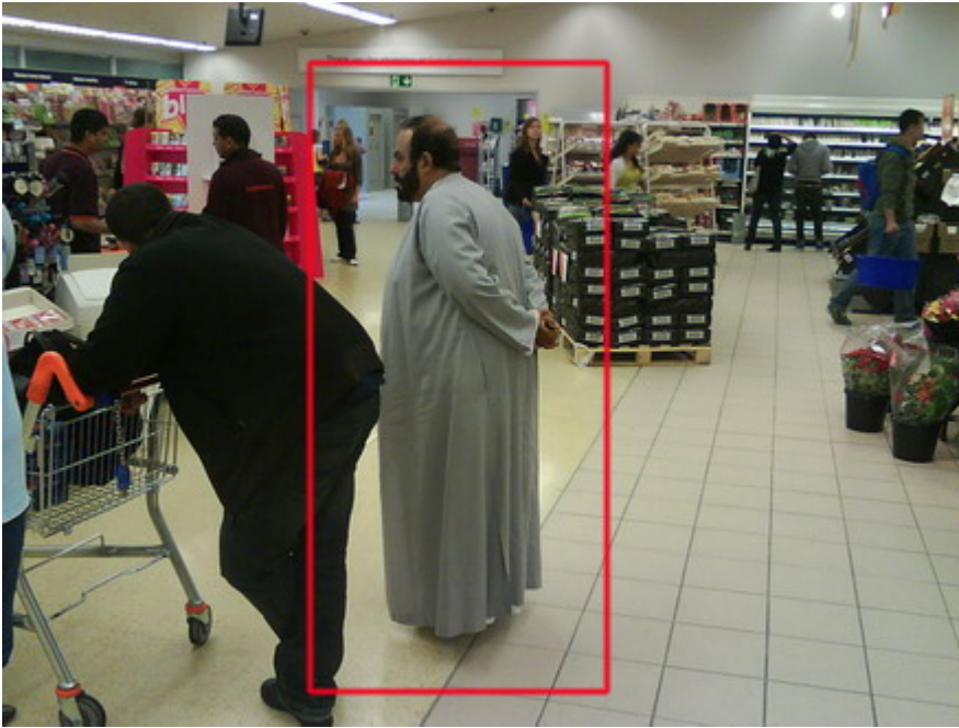
(Text und Fotos von „Federvieh“)