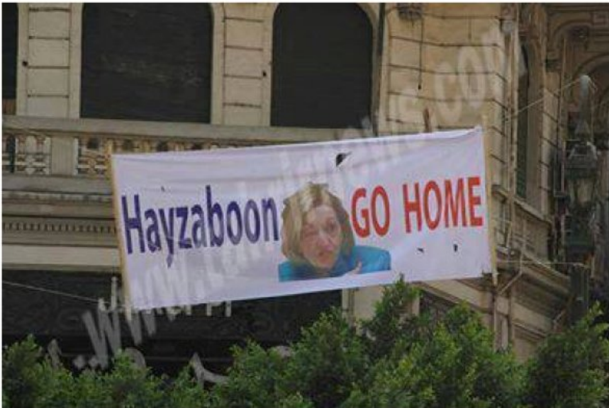
Go back to your home on Obama island. (Pic of Anne W. Patterson the United States Ambassador to #Egypt) #Tahrir