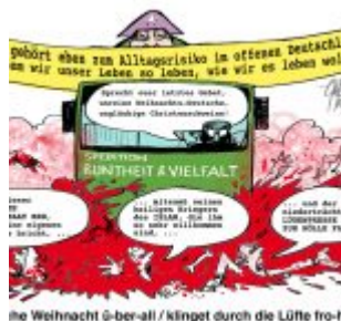
Frö-hö-liche Weihnacht ü-ber-all / klinget durch die Lüfte fro-her Schall