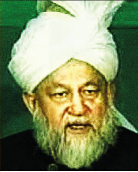
Mirza Tahir Ahmad 4. Kalif der Ahmadiyya

„Beim ersten Aufstieg des Islams war der Untergang der christlichen Völker nicht endgültig, aber sein Wiederaufstieg in unserer Zeit wird die vollständige Verdrängung der Lehrsätze des heutigen Christentums herbeiführen.“