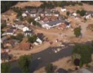
ut im Westen: Querdenker ur ophenhelfern

Von RAMIN PEYMANI ( im Original auf „Liberale Warte“ ) | ... Natürlich standen in den letzten Tagen auch weiterhin die Nachrichten zur Flutkatastrophe im Mittelpunkt. Längst haben die Ökofaschisten das Narrativ gesetzt: Tausende Menschen seien Opfer des Klimawandels geworden. So oft und so penetrant wurde die Lüge wiederholt, dass es an ein Wunder grenzen würde, wenn auch die seriösen Wortmeldungen bei den Bürgern auf Gehör gestoßen wären. Angeführt vom Deutschen Wetterdienst stemmten sich sogar einige wackere Journalisten der Leitmedien gegen den Missbrauch von Opfern, doch die Zahl der Lügner war einfach zu groß. Und das Kartell legte umgehend nach: Rechtsextreme hätten sich in die Flutgebiete aufgemacht, um zu helfen. Sie nutzten die Not der Menschen für ihre Ideologie aus. Das muss man sich mal vorstellen: Da haben die angeblichen Guten nichts Besseres zu tun, als das Leid Tausender für ihre verrückte Klimadoktrin auszunutzen und anschließend davor zu warnen, sich von vermeintlich Rechtsextremen helfen zu lassen. Kann man böartiger sein? Es ist abscheulich.