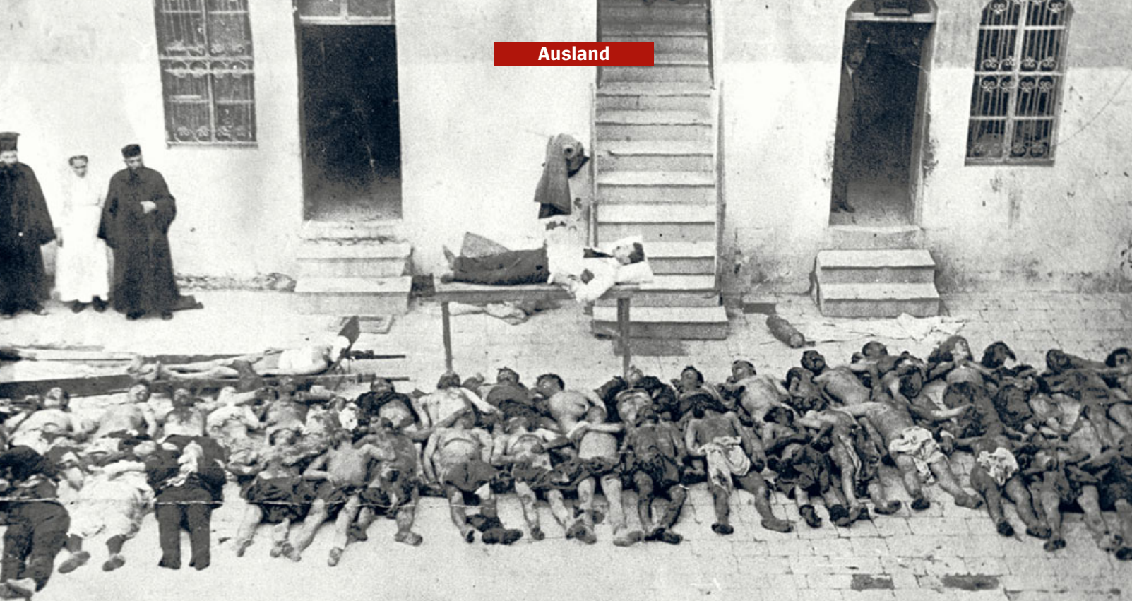
Ermordete Armenier in Aleppo 1919: „Links am Weg liegt eine junge Frau, nackt, nur braune Strümpfe an den Füßen“