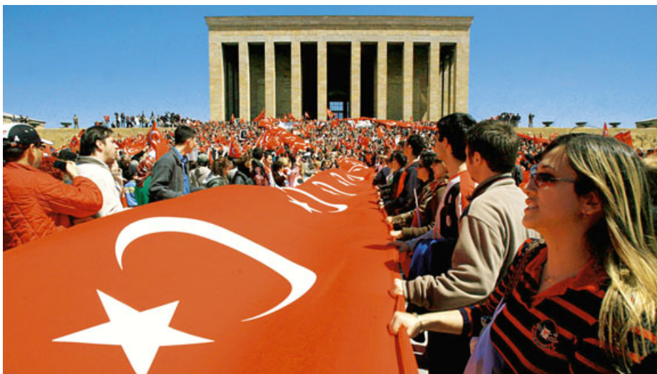
Atatürk-Anhänger mit Nationalfahne in Ankara: Jährliches Drohritual